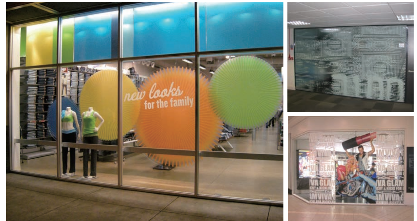
簡易的な広告媒体としての活用や、空間演出のためのディスプレイ装飾など多彩な用途で活用でき、採用が拡大している。

実際に使用しているユーザーからも易施工性・印字適性・速乾性について高評価を得ており、同社ではイベントなどの短期間のガラス装飾に提案している。