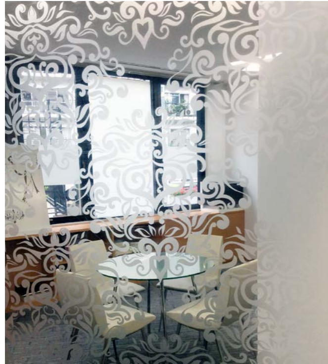
屋内ウインドー装飾用 すりガラス調フィルム