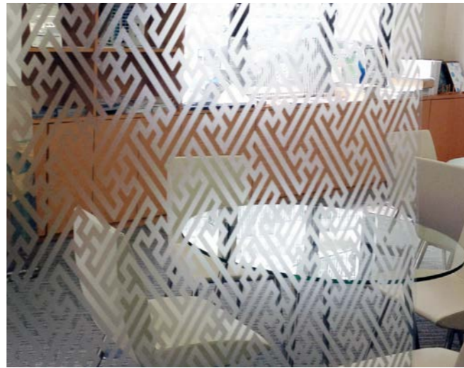
細やかなデザインも、従来のカッティングでは対応が難しかったが、オンデマンド出力により作成が可能となる。