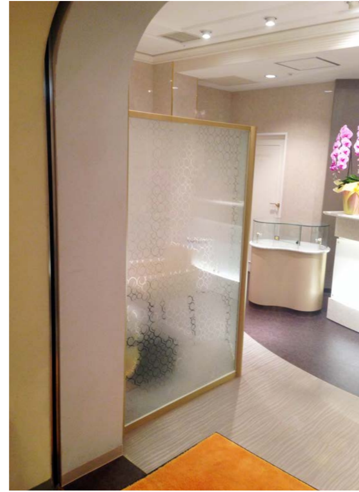
店舗入口のパーテーションに採用。既製品のすりガラス調のフィルムとは異なり、店舗のイメージに合わせ、オリジナルのデザインで装飾することが可能だ。

同社では今後、ドットグラデーションや幾何学模様などのパターン柄を追加予定。さらなる用途拡大を図る。