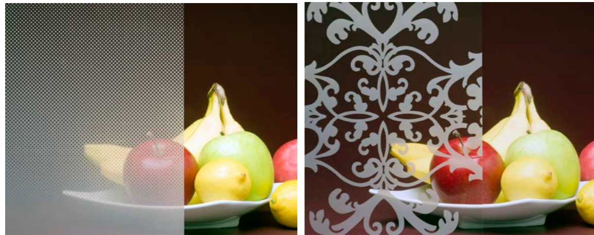
グラデーションやパターンデータなど自由なデザインを出力することができる（写真はイメージ）。