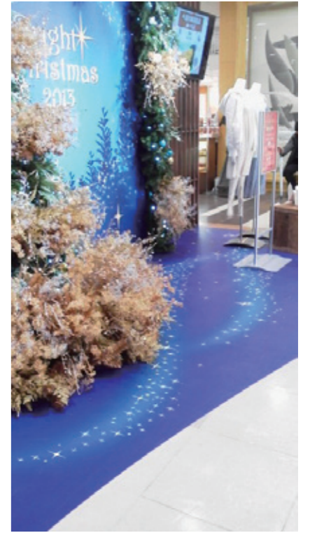
百貨店のディスプレイ装飾として、屋内用フロアマーキングのラミネートが使用されている。