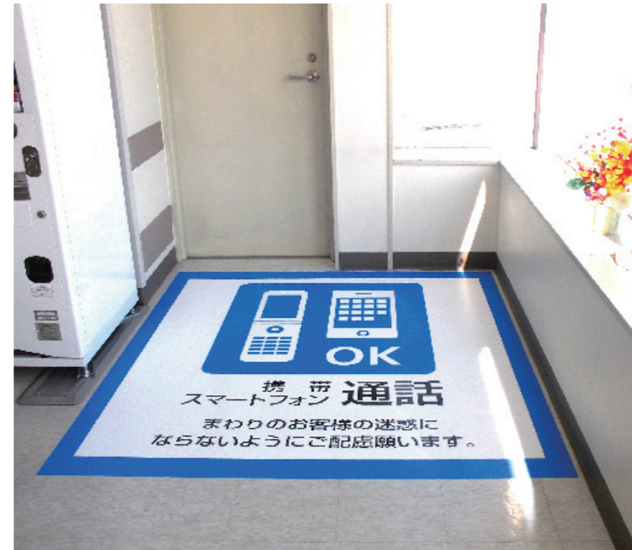
平滑な床面には強粘着タイプの白塩ビメディアとフロアマーキング用のラミネートフィルムを用いている。