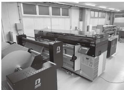
「TOKYO WALL PAPER FACTORY」