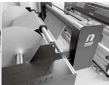
リワインダー(巻き取り装置)