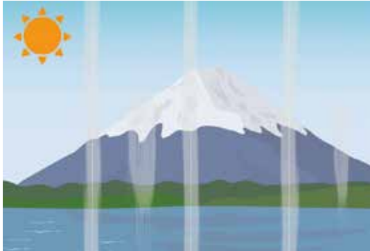
表面に付着した糊を強く擦ったり、拭き取れていなかったりしたためインクが剥がれたり経年で色差が出やすくなる

デジタルプリント壁紙は、最終的にはエンドユーザが施工するだけである。通常の壁紙は、製品と下地(石膏ボード等)との組み合わせで不燃や準不燃などの認定を得ているため、不燃なら十二ミリ、準不燃なら九・五ミリの石膏ボードに施工するだけで法令は守れる。デジタルプリント壁紙の場合は、専用メディアとデジタルプリンタ機器のインク、および下地(石膏ボード等)の三つの組み合わせで認定を得ている。不燃認定の壁紙なら