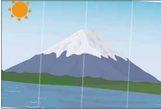
水平を取らず1枚目を斜めに貼ったためデザインが途中で切れる