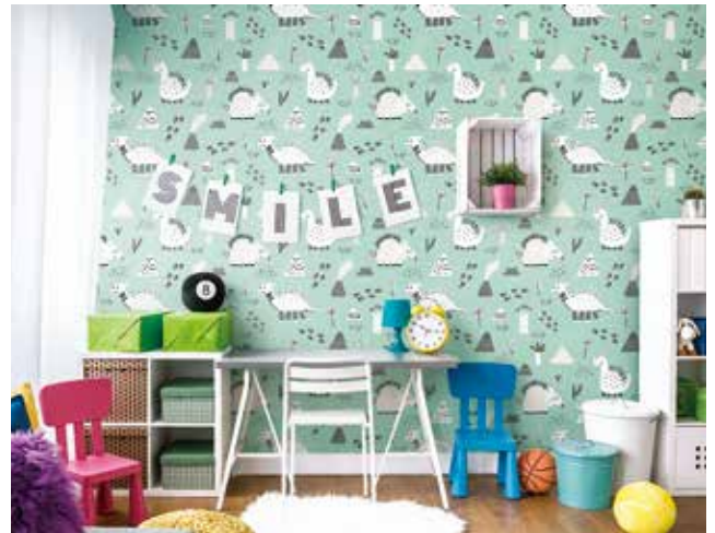
デジタルプリント壁紙施工イメージ

そのために、現在デジタルプリント市場で発生している課題をしっかりと把握しておく必要がある。