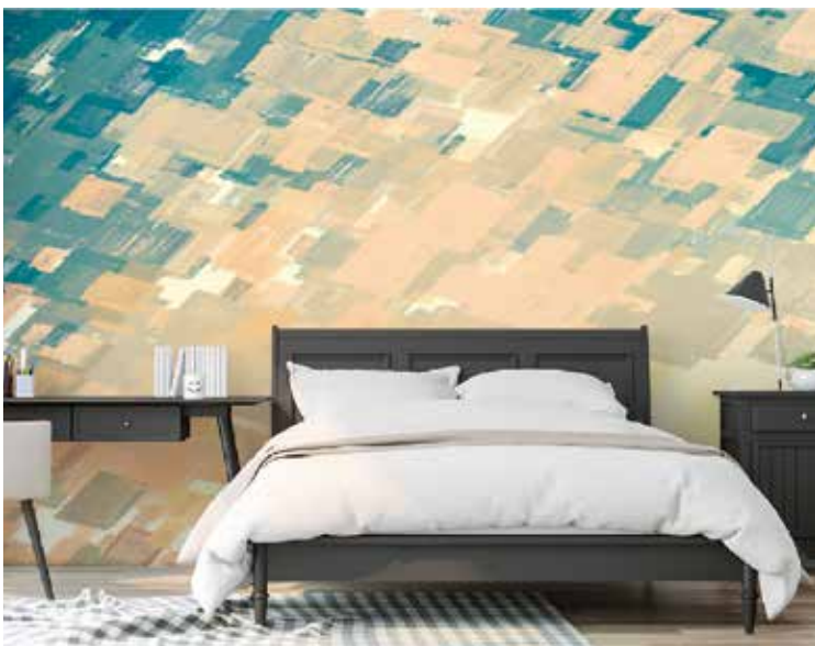
デジタルプリント壁紙施工イメージ

二〇二〇年春からはじまったコロナ禍の約一年半、「おうち時間」の増加でホームユース向けのインテリア需要が拡大した一方、行動制限や外国人観光客の激減によって、ホテルや商業施設関連の内装需要は厳しい状況が続いている。そうした中で、ホテル・