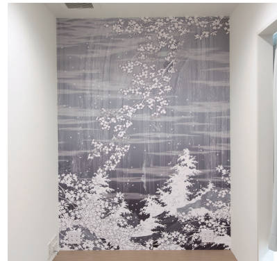
デジタルプリント壁紙の施工例

2000年11月に「デジタルプリント壁紙プリンテリア」を発売以来、一貫して防火認定・各種認定をクリアした、大判プリント品とその専用メディアを発売。出力・施工店に対する防火認定証明書の発行管理も含め、全国展開してきました。