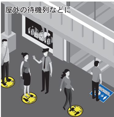
代表的な下地 凹凸のアスファルトや タイル